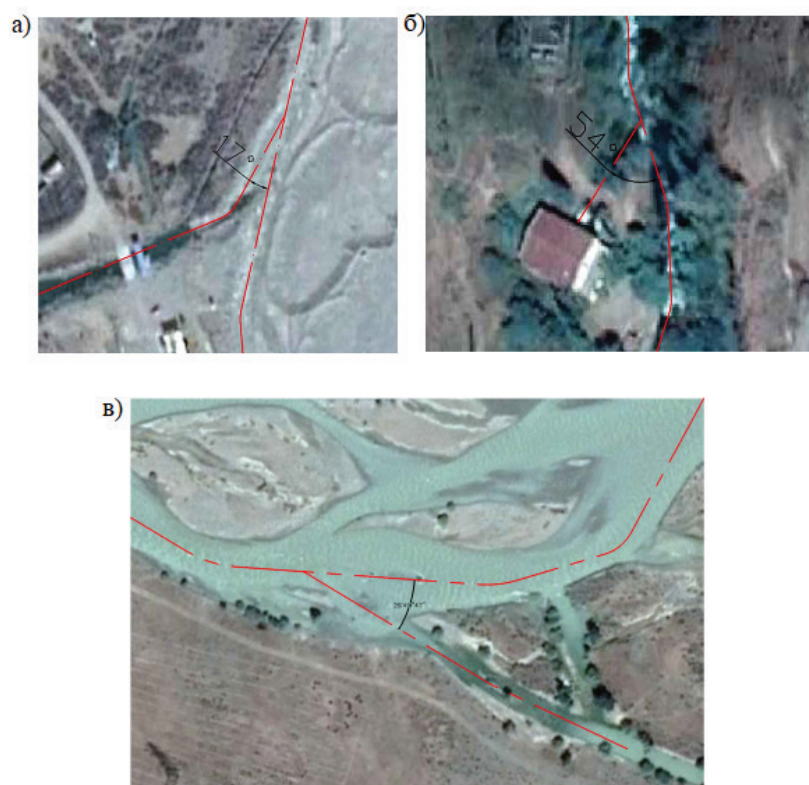
Рисунок 3 – Схемы сопряжения отводящих каналов деривационных ГЭС и отводящих русел рек: а – сопряжение канала Иссык-Атинской ГЭС с рекой Иссык-Ата; б – сопряжение канала Калининской ГЭС с отводящим руслом реки Кара-Балта; в – сопряжение отводящего канала Кеминской ГЭС с руслом р. Чу

Определенным затруднением является определение величины коэффициента, учитывающего местные условия сопряжения k . Поскольку результаты анализа существующих условий сопряжения отводящих каналов с отводящими руслами (рисунок 3) показывают, что значение коэффициента зависит от углов сопряжения, а также от отношения энергетических характеристик сопрягаемых потоков.