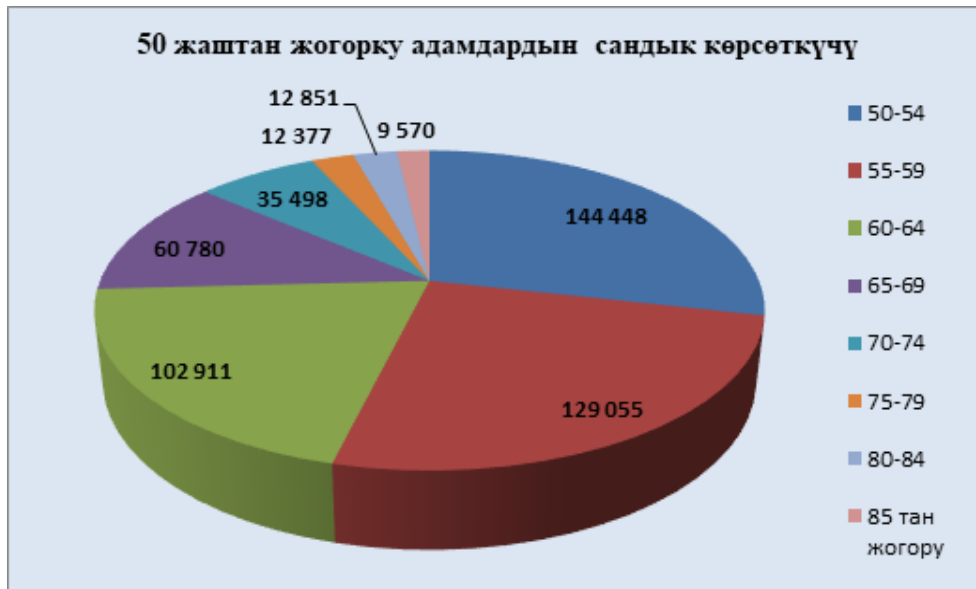
1-сүрөт. Кыргыз Республикасындагы 50-жаштан догоруку адамдардын 2021-жылга сандык көр-көткүчү (Мамлекеттик статистикалык комитетинин маалыматынын негизинде түзүлгөн) [9, 1-б.].

Бириккен улуттар уюмунун белгилеген түзүмүнө таяна турган болсок, кары адамдардын саны жалпы калктын санынын 4 пайзынан төмөн болсо, анда ал өлкө жаш өлкөдө эсептелинет, ал эми, кары адамдардын саны жалпы калктын санынын 4 пайыздан 7 пайызын түзсө, ал өлкө карып бара жаткан өлкө болуп эсептелинет. Эгерде калктын жалпы санынан кары адамдардын саны 7 пайыздан жогору болсо анда, ал өлкө карып калган өлкө болуп эсептелинет [3, 18-б.].