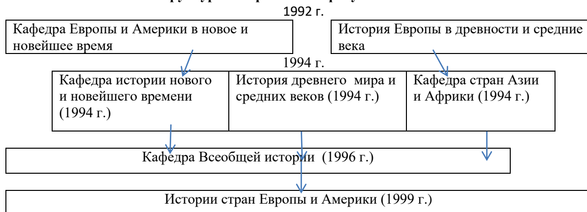
Рис. 1. Структура исторического факультета в 1991-2005 гг.

Как видно из рис. 1 в поисках путей эффективного решения проблем, представших перед образованием, университет и исторический факультет предпринимали безуспешные попытки преобразования сложившейся годами структуры факультета, частые переименования кафедр и их реструктуризацию.