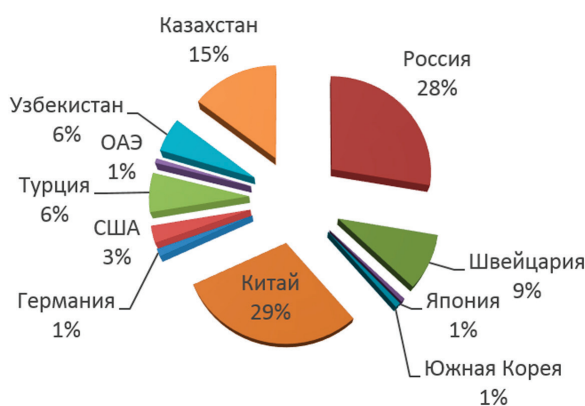
Рисунок 1 – Процентная доля товарооборота Кыргызской Республики с 11 странами (2017 г.) [1, с. 47–50]

Согласно данным графика на рисунке 3, самый большой объем импорта прослеживается в 2006–2007 гг. и с 2010 по 2014 г. Однако наблюдается спад до 2016 г. В 2015 г. импорт товаров из Южной Кореи сократился почти в 2,5 раза. В 2014 г. он составил 123 млн долл., а в 2015 г. – 54 млн долл. Импорт пластмассы в первичной форме сократился на 38 %. Также её импорт продолжал сокращаться и в 2016, и в 2017 гг. В 2015 г. резко сократился импорт легковых автомобилей бывших в употреблении до 98 %, а в 2016 и 2017 гг. – на 100 %. В 2015 г. сократился на 99 % импорт сотовых телефонов. Далее, в 2016 г. по сравнению с предыдущим годом