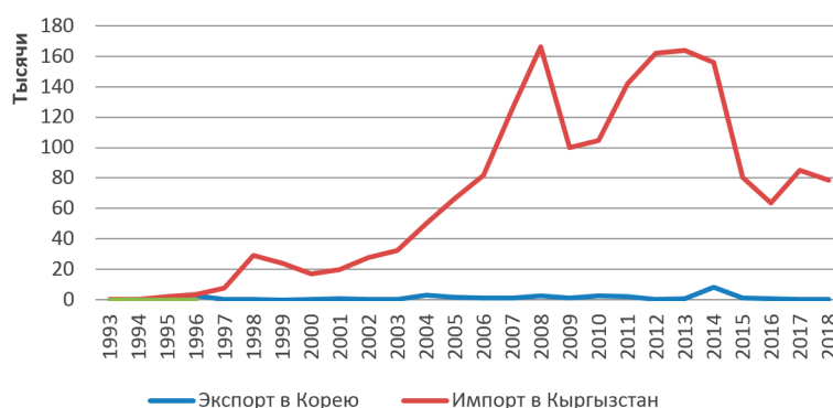
Рисунок 3 – Экспорт и импорт из Южной Кореи [2]

уменьшается импорт новых автомобилей на 96 %. С другой стороны, в 2017 г. по сравнению с 2016 г. импорт новых автомобилей увеличивается на 95,1 %, импорт машин, предназначенных для конкретных отраслей, увеличивается на 82 %. Импорт сотовых телефонов увеличивается на 26 %.