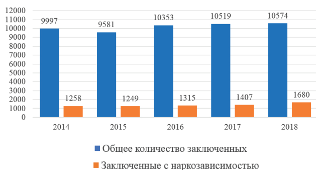
Рисунок 1 – Общее количество заключенных и заключенных с наркозависимостью в пенитенциарной системе Кыргызской Республики с 2014 г. по 2018 г., человек

пробации. В рамках реализации данного проекта инспекторы и социальные работники службы пробации прошли обучение. Также были проведены серии тренингов, которые включали информацию о действующем законодательстве, наркотической политике страны, актуальных программах снижения вреда и социального сопровождения наркозависимых в стране [12, с. 10].