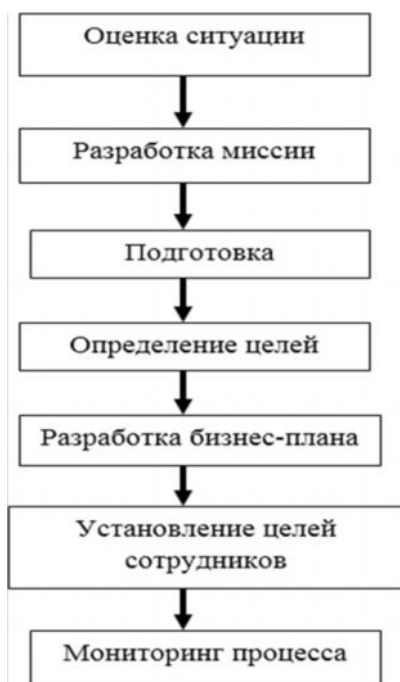
Рис.1. Алгоритм процесса разработки бизнес плана малого предприятия [2, С.23]:

от особенностей предпринимателя, а так же специфики бизнеса и экономики страны, данный «шаблон» может варьироваться самыми разнообразными способами.