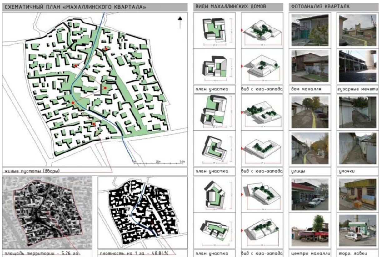
Рис. 2. Анализ «махаллинского квартала»

С точки зрения структуры «махаллинского квартала» можно выявить следующие ключевые особенности: закрытая территория; наличие социально значимых объектов (мечеть, базар); наличие сети дорог и тупиковых пешеходных путей внутреннего пользования; наличие мест отдыха и общения (кафе, столовые); наличие площадок для собрания; малоэтажная застройка; плотная одно- двухэтажная ковровая застройка и другие особенности, характерные только отдельным кварталам.