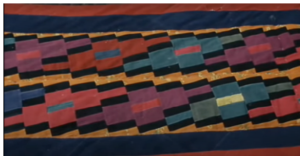
Рисунок 3. Курак из фильма «Бешкемпир»

Актан Арым Кубат далек от городской тематики. В основном он снимает в провинциях, где нет суеты и жизнь течет своим образом. Он практически не использует музыку. Но если она присутствует, то обязательно несет какой-то смысл. В своих фильмах режиссер часто прибегает к кыргызским традициям, ценностям. Например, в фильме «Бешкемпир» в самом начале панорамной съемкой показывают курак 1 (рисунок 3). Курак является выражением искусства и испокон веков несет в себе огромную жизненную философию.