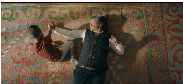
Рисунок 2. Верхний ракурс из фильма «Кентавр»

Первый критерий – это профессионализм, техническая компетентность режиссера. В фильмах Актан Арым Кубата можно увидеть цикличность не только в сюжете, но и в техническом плане. В своих фильмах он часто использует верхний ракурс, тем самым давая зрителю посмотреть на фильм, как на маленький мир. Прежде чем прийти в кино Актан Арым Кубат отучился на художника, и возможно этот самый художественный взгляд повлиял на киноязык режиссера.