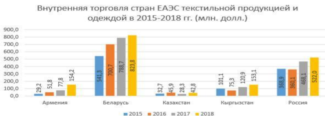
Рисунок 4. Внутренняя торговля стран ЕАЭС текстильной продукцией [4]

Для Кыргызстана реализация политики импортозамещения в рамках своего национального рынка является малоэффективной, т.к. небольшая емкость внутреннего