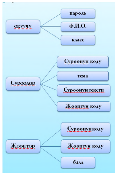
1-схема.Маалыматтар базасынын схемасы

«Бөлчөк сандар» автоматташтырылган окутуучу системасы негизги 6 бөлүмгө бөлүнгөн: