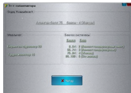
2-сүрөт. Тест жыйынтыктары

Тестирилөө аяктаган соң «Тестирилөөнүн жыйынтыктары» формасы ачылат.