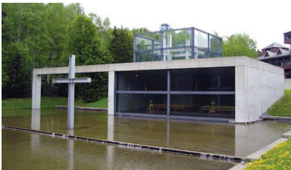
Рисунок 5 – О. Хоккайдо. Храм на воде, архитектор Тадао Андо