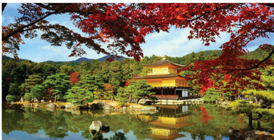
Рисунок 4 – Золотой павильон Кинкаку-дзи в Киото в разное время года