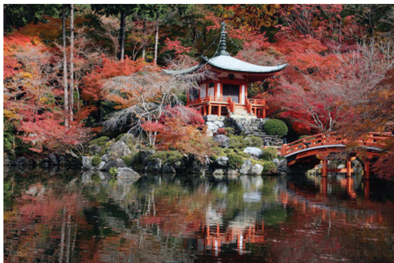
Рисунок 2 – Киото. Монастырь Дайгодзи, павильон Самбоин, 1115 г.

причину любви японцев к недосказанности, иррациональности. «Сибуй» дает нам возможность проникнуть внутрь природы и открывает нам высоты восприятия всеобщего сознания истинности вещей. «Сибуй» требует ассиметричной логики построения пространства, соучастия зрителя в создании образа пространства, например в интерьере, и экстерьере чайного домика (рисунок 3). Понятие незавершенности присутствует в искусстве, в большинстве сфер культуры и во многих японских обычаях. «Сибуй» требует активного участия зрителя. По словам японского писателя Какудзо Окакура «истинная красота открывается только тому, кто мысленно может завершить незавершенное» [3]. Сибуй – это красота естественности в сочетании с красотой простоты. Сами японцы говорят, что сибуй – это то, что человек с хорошим вкусом называет прекрасным, универсальным критерий оценки.