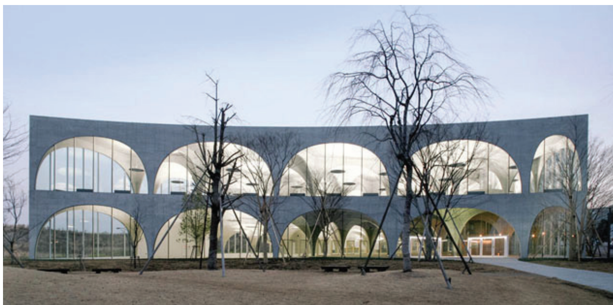
Рисунок 7 – Библиотека Университета искусств Тама в Токио, архитектор Тойо Ито