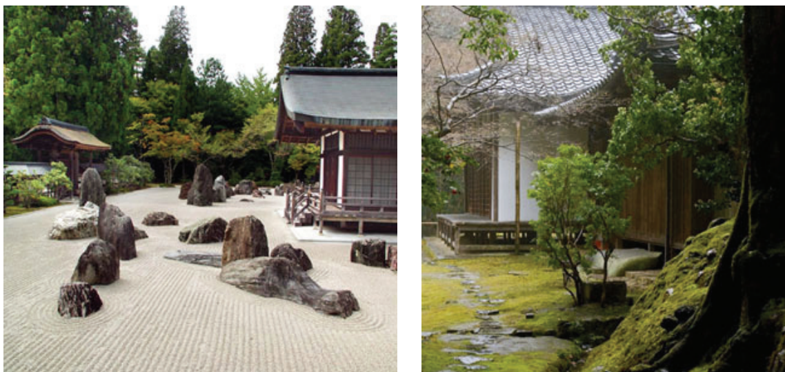
Рисунок 6 – Киото. Монастырь Рандзи. Сад Рёдзи; тясицу – чайный домик