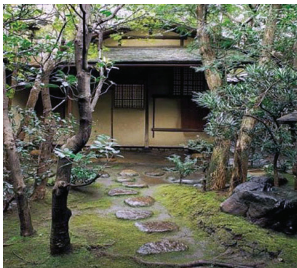
Рисунок 3 – Тясицу – чайный павильон

зону, которая намекает зрителю на вечность или потусторонний мир. Это – эстетическое чувство югена (рисунок 5). Югэн поэтизирует изменчивость, недолговечность и недосказанность. Не принимая завершенность, югэн отрицает и симметрию, считая ее также несовместимой с вечным движением жизни. Асимметрия олицетворяет живой и подвижный мир. Лауреат Притцкеровской премии Тадао Андо говорит: «Мы должны создавать архитектуру, которая, подобно поэзии или музыке, будет открытием для человека, пробуждая интеллект, мир и радость жизни» [5, с. 10]