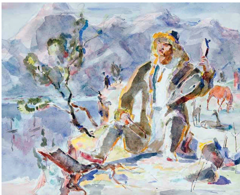
Рисунок 1 – Баки Урманче. “Молодой Коркут” 1942

художественной жизни в целом – все эти и другие события создали необходимую творческую среду для расширения жанрового и образно-тематического спектра изобразительного искусства Азербайджана в конце 1940 – начале 1950-х гг.