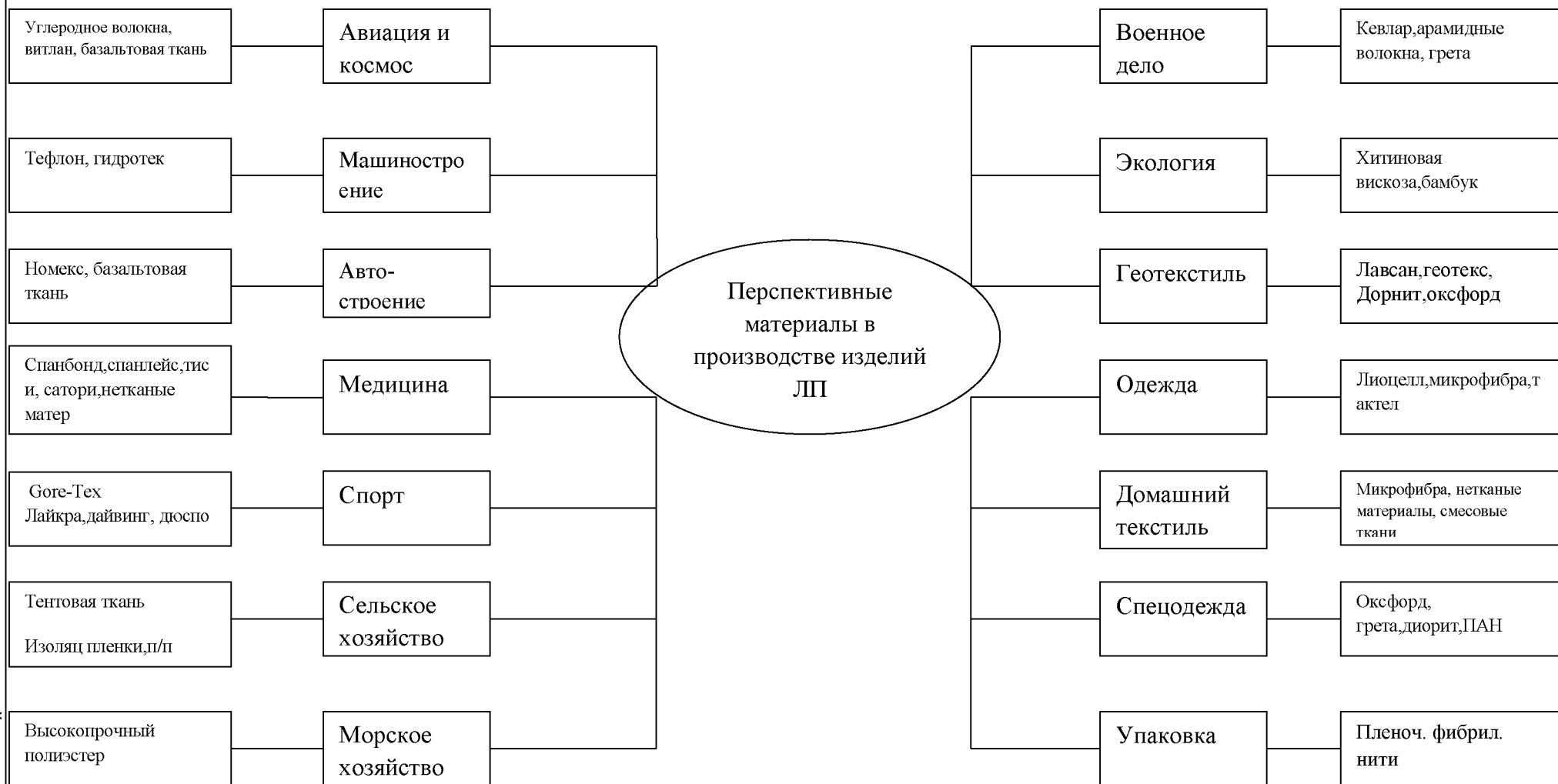
Рис.2. Перспективные материалы в производстве изделий легкой промышленности