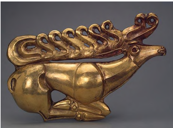
Бугу алтын тогоо. б.з.ч. VIылым Санкт-Петербург Эрмитаж.

Жогоруда белгилегендей, алар буюмдун жергиликтүү формасын бир жаныбар менен экинчи бир айбанаттын сырт көрүнүштөрү аркылуу айкалыштырып кооздоп, шөкөттөп турат. Жергиликтүү архаикалык чыгармалардын стилдик өзгөчөлүгүнүн бири, формаларды геометриялап белгилөө. Жалпак сүрөттөлүштөрдө, башында мүйүз, кулак, бут бирге сүрөттөлүп, кулак жагы көрүнбөй калган, бирок башы менен тулку – бою деталдаштырылып көрсөтүлгөн, жасалышы схемалаштырылып, шарттуу түрдө чагылдырылган.