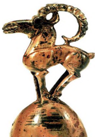
Тоо текенин бедизчеси. б.з.ч. V—III кк. Эрмитаж. Санкт-Петербург.

Айбанаттар стили – байыркы доорлордогу адамдарга таандык искусстводогу кеңири тараган стилдик шарттуу аталыш. Ал өзгөчө скиф – сармат доорлорунда кеңири тараган көркөм өнөр (искусство). Анын айрым элементтерин Энесай кыргыздарынын доорундагы эстеликтерден кездештирүүгө болот.