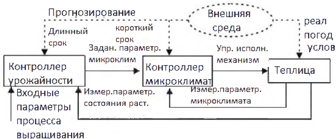
Рис. 3. Иерархическая двухуровневая система управления урожайностью теплицы

На рис. 3 представлен предложенную структуру двухконтурной иерархической системы управления урожайностью тепличного хозяйства. Внешний контур решает задачу оптимального управления в масштабе суток и недель. Для решения используются данные относительно актуального состояния урожая, долгосрочного прогноза погоды, перспективы изменения реализационной цены продукции. Такой расчет может происходить регулярно (зависит от типа растений), например раз в неделю, или по мере поступления необходимой информации: изменение прогноза цены или погодных условий.