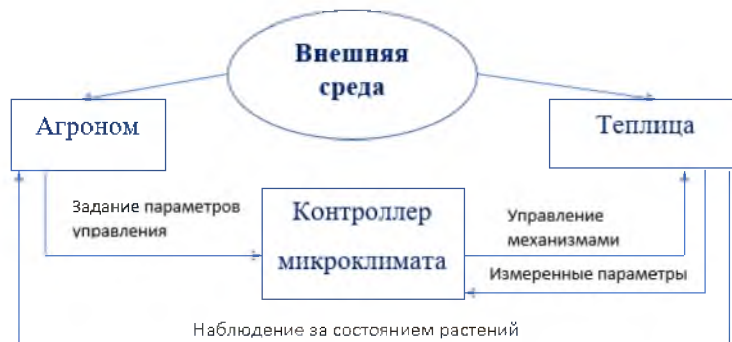
Рис. 1. Структура традиционной системы управления теплицей

Традиционные системы управления, которые часто используются сегодня (рис. 1), базируются на знаниях или опыте сельхозпроизводителя. Агроном, руководствуясь типом растений, их состоянием и этапом выращивания, определяет параметры микроклимата теплицы, которые устанавливаются как задача для системы управления микроклиматом. Современные системы управления тепличных комбинатов могут насчитывать до 150 различных параметров [2], которые агроном должен определить и поставить задачу климатическому компьютеру по достижению соответствующего режима с помощью имеющихся технических средств - исполнительных механизмов системы управления. Наблюдение за состоянием растений и долгосрочные погодные прогнозы могут повлиять на решение сельхозпроизводителя по изменению параметров в процессе выращивания.