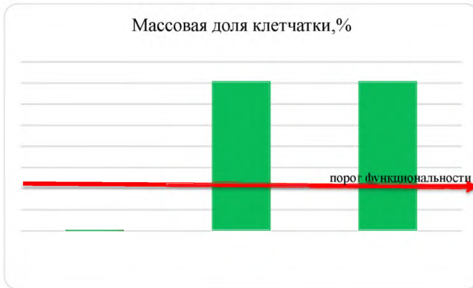
Рис. 2. Результаты определения массовой доли клетчатки, %

Установлено, что больше всего клетчатки содержится в образце с добавлением гречневой лузги в совокупности с порошком ИК-сушки свеклы, тогда как в контрольном образце ее содержание близко к нулю. Содержание клетчатки составляет более 15% от рекомендуемой суточной нормы, что доказывает функциональность готовых изделий (рис.2) [3].