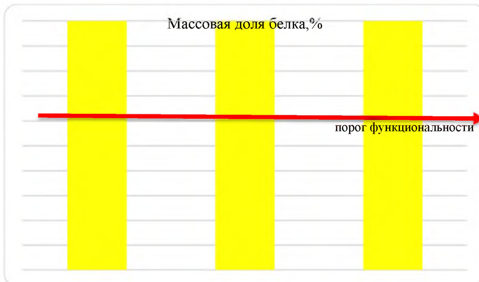
Рис. 3. Результаты определения массовой доли белка, %