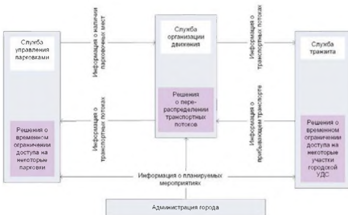
Рисунок 2 - Схема информационного обмена между некоторыми модулями ИТС

Важнейшую роль, помимо комплекса мероприятий по решению транспортных проблем крупных городов, ИТС играют в создании и развитии (реконструкции) УДС. В настоящее время практическое решение любой проблемы в области ОДД не представляется без массива соответствующей информации - характеристики транспортных и пешеходных потоков, соответствующий аппарат их обработки, основанный на современных компьютерных технологиях, имитационное моделирование дорожно-транспортных ситуаций и многое другое.