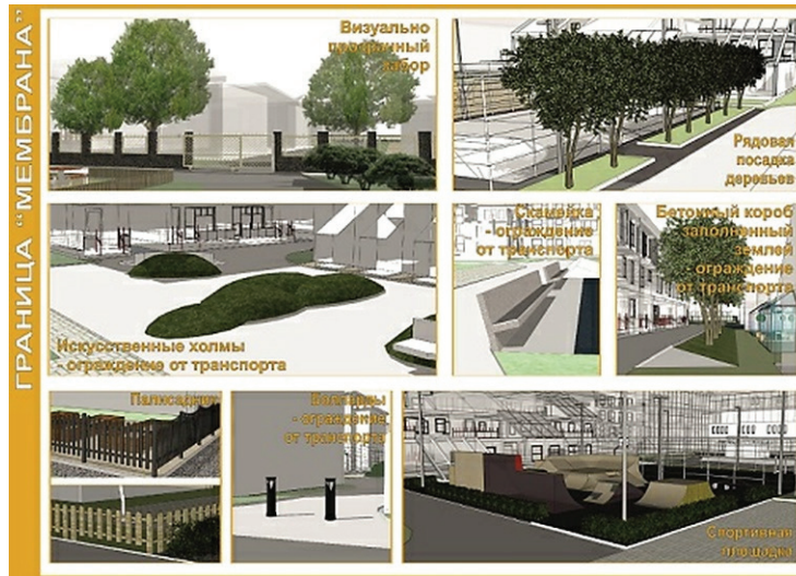
Рисунок 3 – Граница-мембрана. Возможные архитектурно-планировочные приемы решения визуально прозрачных, но физически условно преодолимых границ в дворовых территориях (эскиз Е.Г. Апциаури)

рольны родителям и чувствуют себя в безопасности. Организованные на территории двора проезды и парковки могут стать источником опасности. Важнейшей задачей благоустройства двора становится создание барьеров безопасности, ограждающих играющих детей от автотранспорта. Места игровых зон достаточно выделить границами-мембранами в виде скамеек, незначительных перепадов рельефа, столбов-боллардов, столбов-светильников, которые станут препятствием для въезда на площадки транспортного средства.