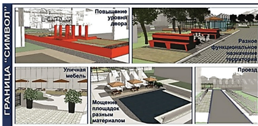
Рисунок 4 – Граница-символ Возможные архитектурно-планировочные приемы решения визуально прозрачных, и физически легко преодолимых границ в дворовых территориях (эскиз Е.Г. Апциаури)

террасной доской территория может быть использована как место для общения, наблюдения и релаксации на солнце.