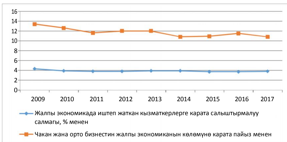
2 – сүрөт. Чакан жана орто бизнестин 2009 - жылдан 2017 - жылга чейинки сатып өткөрүүдөн түшкөн акчанын көлөмү жалпы ички дүң продуктта жана кызматкерлеринин саны жалпы экономикада иштеп жаткан кызматкерлердин санына карата салыштырмалуу салмагы

Кийинки 2-сүрөттө чакан жана орто бизнестин 2009-жылдан 2017-жылга чейинки сатып өткөрүүдөн түшкөн акчанын көлөмү жалпы ички дүң продуктта жана кызматкерлеринин саны жалпы экономикада иштеп жаткан кызматкерлердин санына карата салыштырмалуу салмагы көрсөтүлгөн.