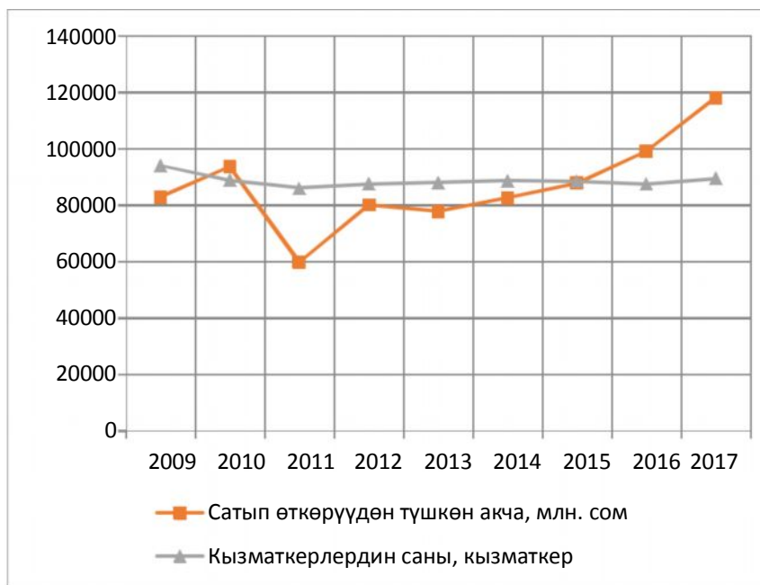
1 – сүрөт. Чакан жана орто бизнестин 2009 - жылдан 2017 - жылга чейинки сатып өткөрүүдөн түшкөн акчанын көлөмүнүн жана кызматкерлеринин санынын динамикасы

Чакан жана орто бизнестин 2009 - жылдан 2017 – жылга чейинки сатып өткөрүүдөн түшкөн акчанын көлөмүнүн жана кызматкерлеринин санынын динамикасын 1-сүрөттөн көрүүгө болот.