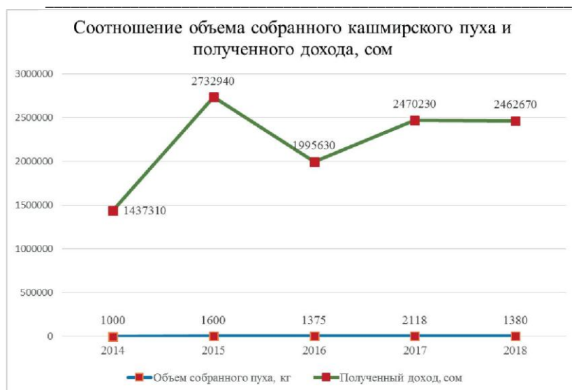
График 1. Соотношение объема собранного кашмирского пуха и полученного дохода, сом.

Правительство Кыргызской Республики инвестировало 1 648 080 сомов на вакцинацию коз против болезней. На всех этапах реализации данного проекта была фасилитация со стороны программы «Бай Алай», без выполнения обязательств сторон. Считаю, что такой подход послужил основой успешной реализации данного проекта, так как все стороны получили достаточно хороший доход (см. график 1).