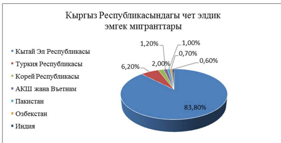
2-сүрөт. Кыргыз Республикасындагы чет элдик эмгек мигранттары

2017-жылдын 1-октябрына карата чет өлкөлүк жарандар тарабынан ачылган компанияларда, окуу мекемелеринде жана чет өлкөлүк жумушчу күчүн тартууга укугу бар адамдарда 58,4 миң Кыргыз Республикасынын жарандары жумуш менен камсыз болушкан. Жаны түзүлүп жаткан, биринчи жолу чет өлкөлүк жумушчу күчүн тартууга уруксат алууга кайрылган ишканалардын жана уюмдардын саны көбөйгөн. Себеби 2017-жылдын башынан баштап Кыргыз Республикасынын Ички Иштер Министирлигинин консулдук кызматынын Департаменти чет өлкөлүк жарандарга эмгек визасын берүүнү жана узартууну жөнөкөйлөткөн.