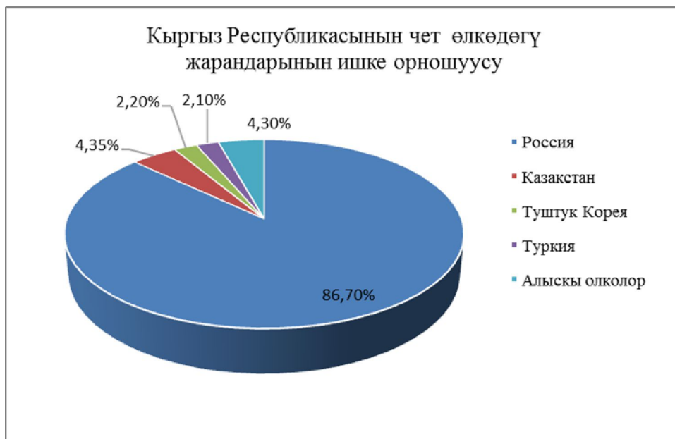
1-сүрөт. Кыргыз Республикасынын чет өлкөдөгү жарандарынын ишке орношуусу

Биздин өлкөдөн эмгек мигранты болуп, жумуш издеп кеткендердин расмий саны 2016-жылга карата Кыргыз Республикасынын өкмөтүнүн астындагы миграция боюнча Мамлекеттик кызматтын маалыматы боюнча 710 миңди түзгөн. Анын ичинен 616 миңи Россияда, 30 миңи Казакстанда, 15 миңи Түштүк Кореяда, 14 миңи Түркияда, ал эми 30 миңи алыскы чет өлкөлөрдө иштеп жатышат. Кыргызстандын экономикалык активдүү калкынын \frac{1}{4} бөлүгү чет өлкөдө иштеп, үй-бүлөсүн багып жатат десек болот.