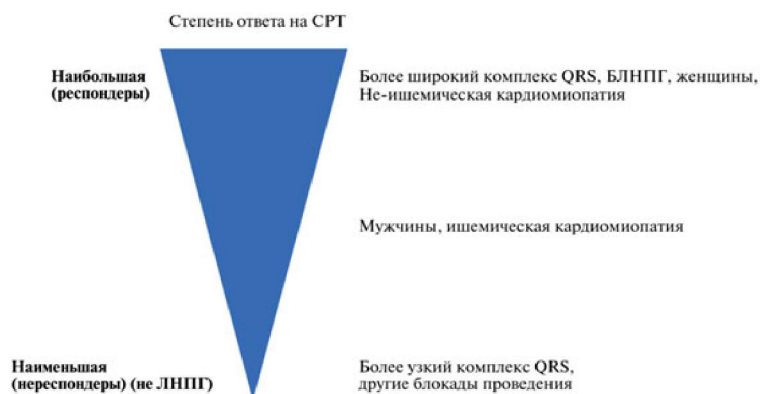
Рисунок 3 – Факторы, влияющие на «за» и «против» эффективности СРТ

Кроме того, недостаточно доказательств для определения эффективности СРТ с и без ИКД. По сравнению с СРТ развитие инфекции устройства была несколько более распространена у пациентов, получавших СРТ-ИКД [22].