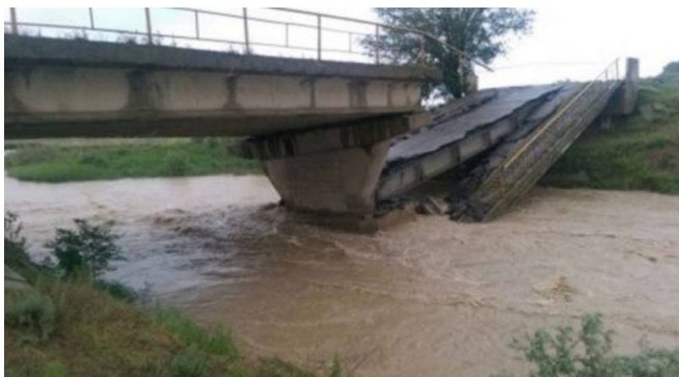
Рис. 5. Аварийное разрушение моста в результате подмыва опоры

На основе рассмотрения основных причин аварийных разрушений мостов можно прийти к заключению, что наиболее частыми являются ошибки на стадии эксплуатации и непредвиденные обстоятельства. Многие причины аварий обусловлены человеческим фактором, следовательно, подобных ситуаций можно избежать. С целью предупреждения и снижения количества подобных ошибок рекомендуется следующее: