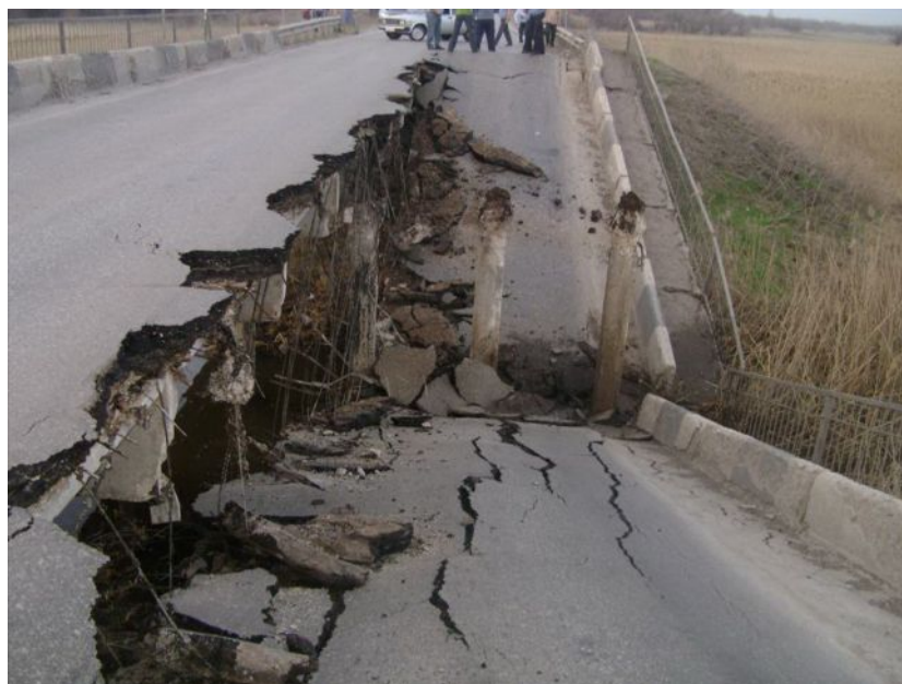
Рис. 4. Аварийное разрушение моста на автомобильной дороге