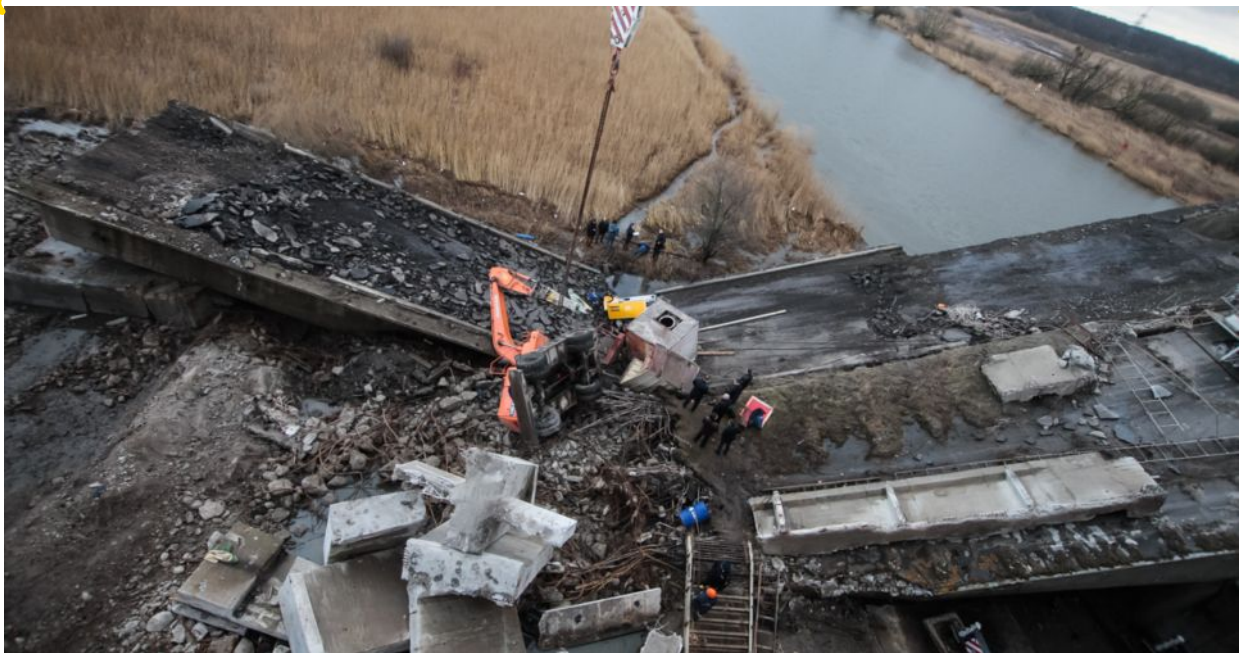
Рис. 3. Аварийное разрушение моста вследствие нарушения порядка очередности проведения демонтажа

Причиной подобных случаев является нарушение технологии производства строительных работ, низкое качество изготовления и монтажа элементов конструкций, или халатное отношение к рабочим обязанностям, отсутствие должного контроля со стороны руководства.