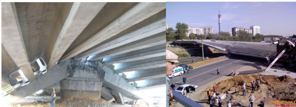
Рис. 2. Аварийное разрушение путепровода

Под пролетное строение путепроводов с большим габаритом целесообразнее устраивать опоры стоечного или столбчатого типа, что позволяет уменьшить консоли ригеля.