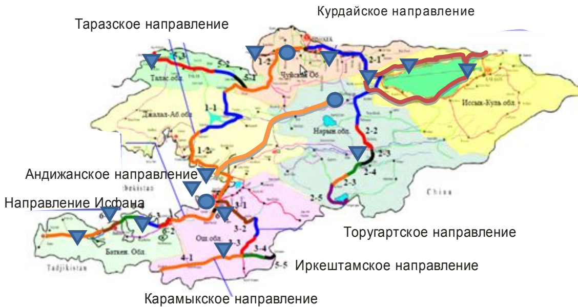
Рис. 1. Международные транспортные коридоры КР.

Строительство логистических центров должно производиться вблизи международных трасс Великого шелкового пути (рис. 1). Именно там с точки зрения логистики в будущем будут сосредоточены грузопотоки, связывающие Восток с Западом, Ближним Востоком, с Средиземноморьем, Россию с странами Южной Азии. Как и владельцы древних караванов, грузоперевозчики ищут кратчайшие пути для доставки своих товаров. И эти пути проходят через Кыргызстан.