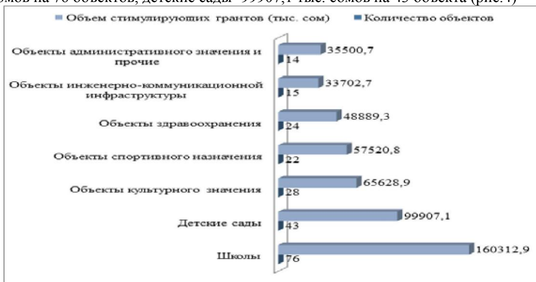
Рис. 4. Количество и объемы стимулирующих грантов по категориям в 2016 году, тыс. сом (составлен по данным Минфина КР) Перечень проектов на получение долевых (стимулирующих) грантов составляется на основании решений комиссий по отбору проектов на уровне районов, городов областного значения и в соответствии с объемами квот.

Количество и объемы стимулирующих грантов по категориям в 2016 году распределились следующим образом: основная их часть направлена в школы - 160312,9 тыс. сом на 76 объектов, детские сады- 99907,1 тыс. сом на 43 объекта (рис.4)