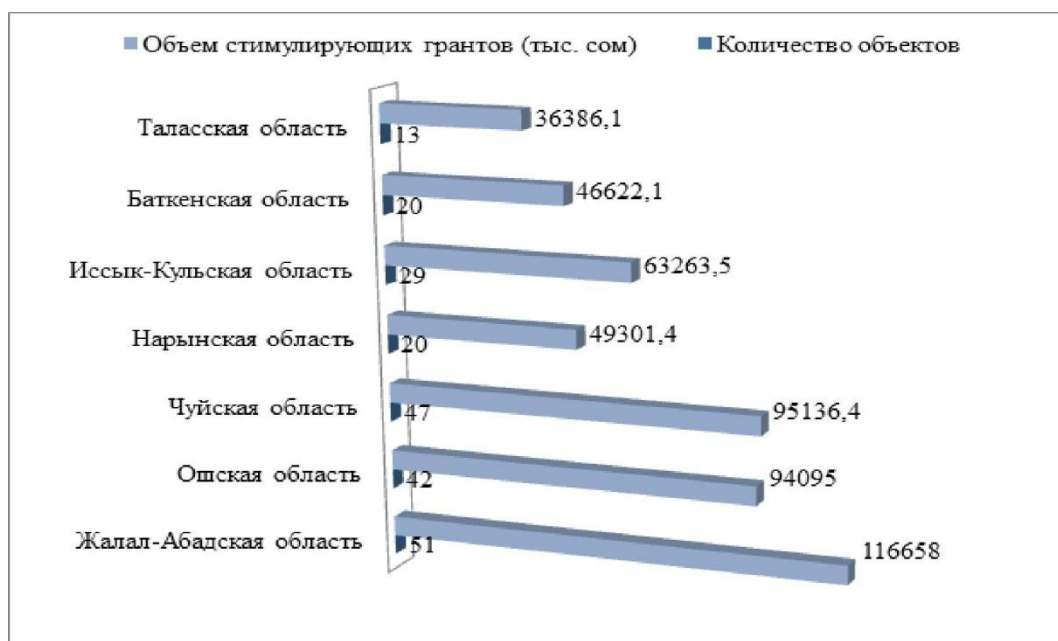
Рис. 3. Количество и объемы стимулирующих грантов в разрезе регионов в 2016 году, тыс. сом (составлен по данным Минфина КР)

В 2016 году за счет долевых (стимулирующих) грантов на реализацию утверждены 222 проекта с потребностью на сумму 501 млн 462,5 тыс. сомов.