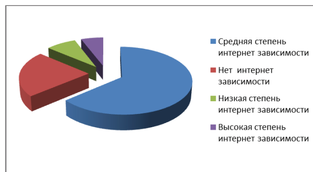
Диаграмма 1. Степень интернет-зависимости подростков по методике Кимберли Янга

Для изучения общей интернет зависимости и ее степеней среди подростков нами проведено исследование в средней школе № 71 им. Т. Молдо города Бишкек. В нашем исследовании приняли участие учащиеся 9 «А» и 9 «В» классов в количестве 50 человек (25 девочек и 25 мальчиков). В процессе исследования мы опирались на модифицированный тест-опросник Кимберли Янга, переведённым на русский язык и адаптированный В. Лоскутовой. [3]