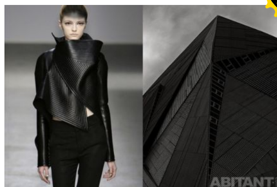
GarethPugh - офисное здание в Сингапуре