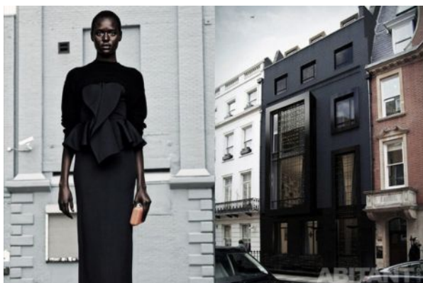
Фэшн-проект InMyCastle - цветущая бугенвиллея