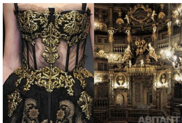
Dolce&Gabbana - королевская ложа Маркграфского оперного театра Поделитье

Заключение. В итоге анализа мода - как искусство создания костюма, наряду с архитектурой явление эстетическое, это часть художественной культуры отдельной страны, эпохи, человечества в целом, и она отражает определённый этап в развитии культуры человечества. Таким образом, мода и архитектура, влияя на моральные, эстетические, политические и другие аспекты человеческого общества, способна оказывать влияние и на культуру в целом. Мода сама стала представлять собой своеобразный вид искусства, через который люди выражают свои чувства и свою индивидуальность. Взаимосвязь и взаимовлияние моды и архитектуры друг на друга несомненны. На протяжении веков мода шла и менялась синхронно с переменами в архитектуре, отражая их.