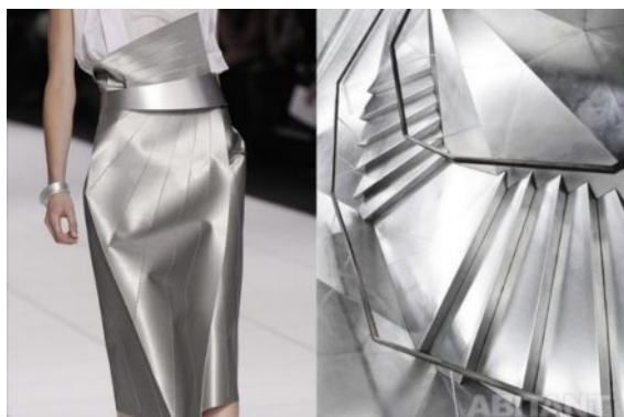
MaryKatrantzou - интерьер лобби GreenbrierResort Западной Вирджинии