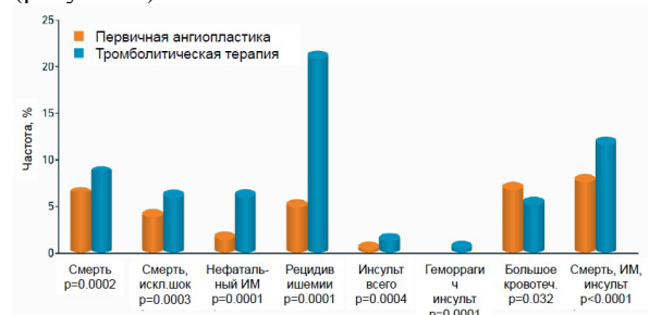
Рисунок 2 – Мета-анализ данных 23 рандомизированных исследований по сравнению с тромболитической терапией и первичной ангиопластикой [12]

онной терапии в ранние сроки позволяет значительно улучшить клинические исходы заболевания [10, 11]. В связи с этим краеугольным камнем успешной терапии является возможность проведения своевременной тромболитической терапии (ТЛТ) (рисунок 2).