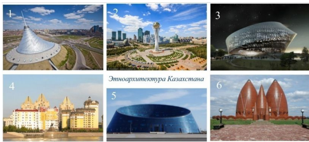
Рис.1. 1) Хан-Шатыр. 2) Байтерек. 3) Проект Национальной библиотеки. 4) Жилая застройка набережной реки Ишим. 5) Дворец искусств 6) Мавзолей Карасай и Атантай батыра.

Далее, можно сказать монумент Астаны «Байтерек», он как символ нового этапа в жизни казахского народа. «Байтерек» своим расположением и композиционным строением выражает космогонические представления древних кочевников , по преданиям которых на стыке миров протекает Мировая река. На её берегу возвышается Дерево жизни — Байтерек ( каз. Бәйтерек — «тополь», также «опора, защитник»), корнями удерживающее землю, а кроной подпирающее небо. Корни этого дерева, соответственно, находятся в подземном мире, само дерево, его ствол — земном, а крона — в небесном. Каждый год в кроне Дерева священная птица Самрук откладывает яйцо — Солнце, которое проглатывает дракон Айдахар , живущий у подножия дерева жизни, что символически означает смену лета и зимы, дня и ночи, борьбу Добра и Зла. Также, в Казахскую этноархитектуру входят такие этно-объекты, как на рис 1.