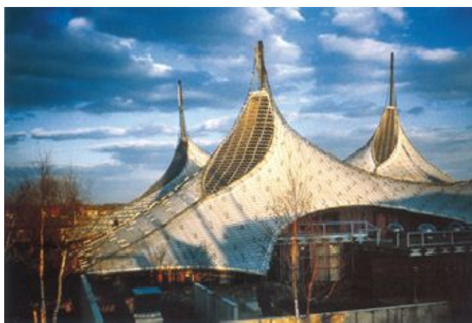
Рис.2. Павильон ФРГ на Всемирной выставке «ЭКСПО»-67 в Монреале. Арх. О. Фрай[5].

В качестве примера, таких проектов еще является «Павильон ФРГ на Всемирной выставке «ЭКСПО»-67 в Монреале (1967)». Автор проекта немецкий архитектор Отто Фрай. Отто Фрай учитывал историю и культуру кочевников и разработал этот уникальный проект, который представляет образ чатыра и алачыка. Получилось сложное покрытие с криволинейными очертаниями, одновременно представляющее собой легкую, прозрачную и чрезвычайно пластичную форму как алачык и чатыр.