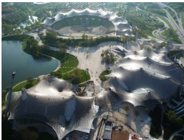
Рис.3. Крыша Олимпийского стадиона в Мюнхене. Арх. Отто Фрай[6].

Например, как видно из частных бесед среди коллег и малочисленных публикаций, в традиционной архитектуре Кыргызстана использование пространственной концепции, мотивов, мифоструктуры и других составляющих юрты, алачыка и чатыра в современной архитектуре одни наши современники считают единственно верным подходом, другие - анахронизмом или узостью мышления. Вместе с тем, следует отметить, что обе точки зрения страдают крайней радикальностью. По всей видимости, в этом сложном вопросе каждый раз от архитектора требуется подлинно творческое по духу тонкое чутье художника, аналитическая глубина мышления ученого, умелая находчивость инженера.