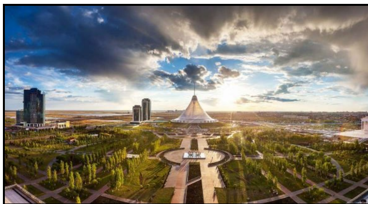
Рис.1. Хан-Шатыр в Казахстане. Арх. Норман Фостер[4].

Среди прекрасных шедевров мировой архитектуры феномен Хан-Шатыра нисколько не теряет свою уникальность. Хан-Шатыр отточенное в своем развитии архитектурно-художественное произведение, поэтому в своем роде несопоставима ни с чем.