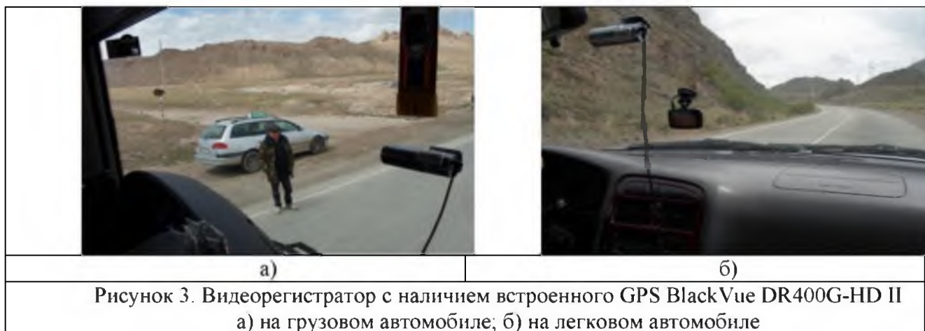
Рисунок 3. Видеорегистратор с наличием встроенного GPS BlackVue DR400G-HD II а) на грузовом автомобиле; б) на легковом автомобиле

Фактические скорости движения записывались на видеорегистратор с наличием встроенного GPS BlackVue DR400G-HD II установленное на лобовом стекле автомобилей (рис. 3). На грузовом автомобиле исследование проводилось 28-апреля 2016 года, за рулем находился водитель с 34 – летним стажем. На легковом автомобиле исследование проводилось 6-мая 2016 года, за рулем находился водитель со стажем 19 лет.