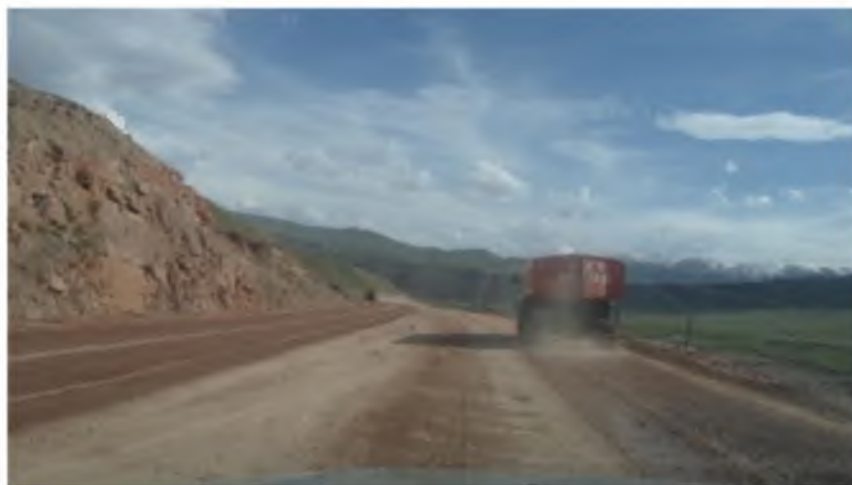
Рисунок 5. Реконструируемый участок дороги Перевал «Долон» (223-244 км)

Ранее проведенные экспериментальные исследования скоростных режимов на легковом автомобиле Тойота-Авенсис по маршрутам Бишкек-Нарын (20.01.2015г.) и Нарын-Бишкек (22.01.2015г.) тоже показала, что на перевальных участках наблюдается резкое снижение скорости около 70% (3 и 6 участок) чем на равнинные, что сказывается на сложность эксплуатации АТС в горных дорожных условиях [2].