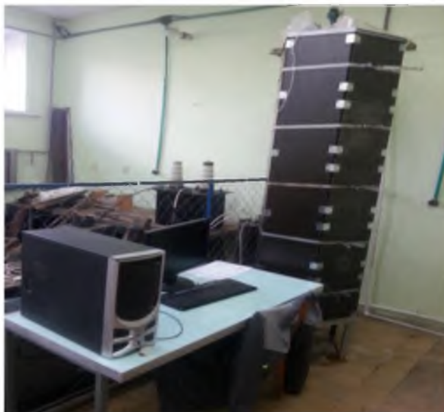
Рисунок 1 – Экспериментальный стенд для исследования

На рисунке 2 показана схема экспериментального стенда для исследования процессов теплообмена грунтовых теплообменниках.