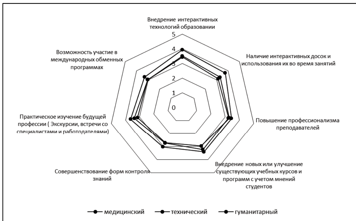
Способы повышения интереса к учебе