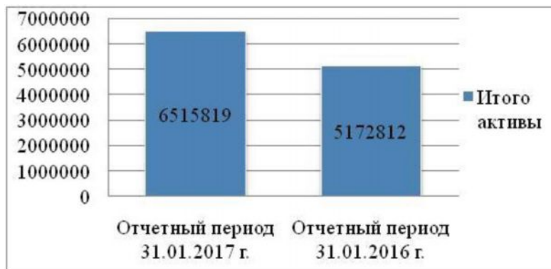
График 1. Сравнительные показатели активов за 2016-2017-гг.

Наибольший удельный вес занимают ссуды, предоставленные клиентам, которые составили 61% в 2016 году, 53% в 2017 году. Это говорит о том, что банк направляет свои ресурсы на доходные активы, то есть на получение максимальной прибыли. Этот показатель говорит о том, что банк ведет умеренную кредитную политику.