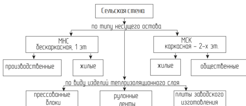
Рисунок 2 – Схема модификации многослойной конструкции “Сельская стена”

5. Нанесение несущего слоя торкрет-бетона. Для торкретных работ необходимо использовать специальное оборудование: пневмобетононасос, компрессорную станцию; растворосмеситель; весы, маячки для определения требуемой толщины торкрет-бетонного слоя. Бетонная смесь наносится под давлением в 2 ат. послойно, толщина одного слоя составляла 25–30 мм.