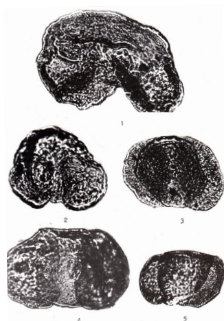
1–5 – Pinaceae (Pg 3 – N 1 )