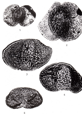
1, 2 – Podocarpus sp. (N 2 ), 3–4 – Picea sp.(N 1 2 ), 5 – Piceae schrenkianaformis Zakl. (N 1 2 )

Судя по палеоботаническому материалу (отпечатки растений и мiosпоры; таблица 1; [4–6]) из верхнетриасовых отложений (норий-рэт) Иссык-Кульского региона в это время (222–208 млн лет назад, [7]) здесь произрастали многочисленные папоротники ( Dictyophyllum exile , D. nilssonii , Cladophlebis schesiensis , Cl. cf. szeina ) с незначительным участием представителей хвощевых ( Neocalamites , Schizoneura , Equisetites ), хвойных ( Podozamites , Cycadocarpidium ) и гинговых ( Baiera , Sphenobaiera , Czekanowskia ). Климат был тёплым и влажным.