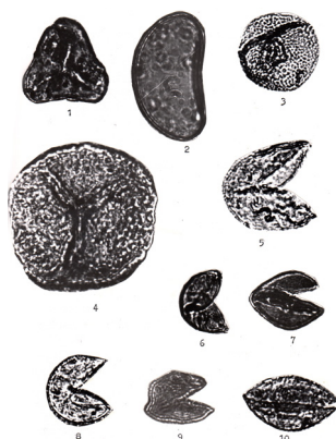
1 – Cyathea sp.(N 1 ), 2 – Polypodium sp.(Pg 3 ), 3 – Osmunda sp.(N 2 ), 4 – Osmunda regalis L. (N 2 ), 5, 6, 8 – Juniperus sp.(N 1 ), 7, 9, 10 – Cupressaceae (N 2 )