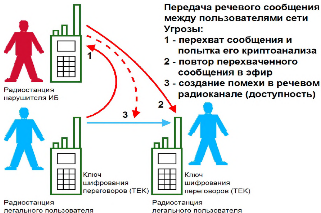
Рисунок 2 – Внешний нарушитель