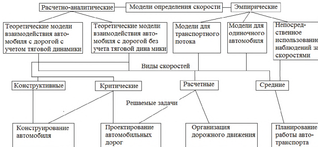
Рис. 1.1. Модели определения скоростей движения транспортных средств и их применение

Для оперативной оценки скоростных режимов движения на автомобильных дорогах, при решении отдельных задач проектирования автодорог используют эмпирические модели определения скоростей одиночного автомобиля или транспортного потока [7,8]. Рассматривая эмпирические модели определения скоростей, нужно отметить подход, связанный с имитационным моделированием движения транспортных потоков в реальных дорожных условиях. Большим преимуществом его является возможность проведения искусственных экспериментов с помощью ЭВМ. Для целей планирования скоростей движения обычно служат различные методы нормирования скоростей, основанные на непосредственных наблюдениях за скоростями движения и выведенным зависимостям [4]. На выходе этих моделей получают средние скорости движения.