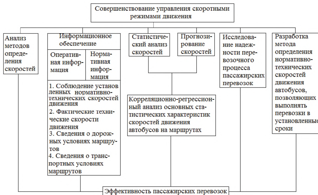
Рис. 1. Структура задачи совершенствования управления скоростными режимами движения

Известные к настоящему времени модели определения скоростей движения можно подразделить на расчетно-аналитические и эмпирические, представленные в виде структурной схемы (рис. 1.1).