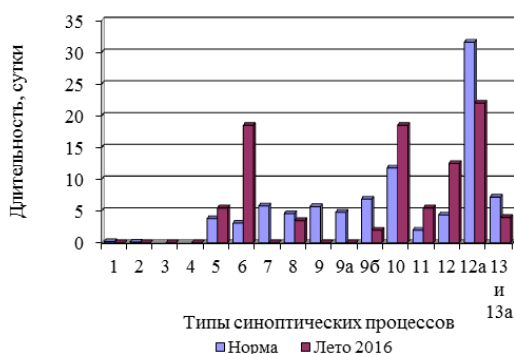
Рисунок 1 – Многолетние средние (нормы) и фактическая суммарная продолжительность типов синоптических процессов летом 2016 г.

Погодные условия Чуйской долины летом 2016 г. определяли 9 типов синоптических процессов (5, 6, 8, 9б, 10, 11, 12, 12а, 13 и 13а) из 17 возможных (таблица 1, рисунок 1). Сухую и очень жаркую погоду приносили характерные для лета типы 11, 12 и 12а. В течение 22 суток наблюдался тип 12а – малоградиентное поле пониженного давления, что оказалось ниже нормы в 1,4 раза. Выше нормы в 2,8 раза отмечались термическая депрессия (тип 11) и малоградиентное поле повышенного давления (тип 12), продолжавшиеся в течение 5,5 и 12,5 суток соответственно.