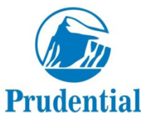
Рисунок 3 – Логотип “Prudential Insurance”

В XX в. логотипы эволюционировали и получили дальнейшее развитие. Одним из первых и известных логотипов, используемых до настоящего времени, был логотип страховой компании “Prudential Insurance” с изображением скалы Гибралтара (рисунок 3).