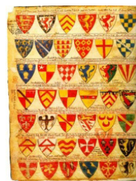
Рисунок 1 – Гербы рыцарей

Цеховая эмблематика – символы, которые стали значительно ближе современному логотипу (рисунок 2). В средние века с развитием ремесленного мастерства появился новый прототип логотипа – личное клеймо мастера. Клеймо идентифицировало работу мастера и помогало ему выделиться среди остальных. Именно клеймо было больше всего похоже на современный логотип. Первым официально зарегистрированным королевским