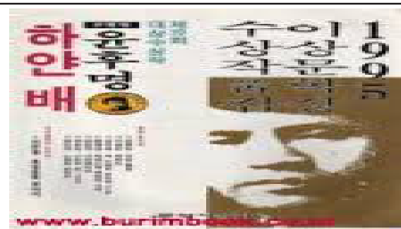
2-сүрөт – Юн Хуумён (윤후명) жазган Ак кеме китеби

Кореяда Чыңгыз Айтматов дүйнөдөгү атактуу автор деп билинген. Чыңгыз Айтматовдун чыгармалары корей тилине дагы которулуп сатылып жатат. Ушуну менен бирге, корей изилдөөчүлөрү Чыңгыз Айтматов жөнүндө макалалар жана диссертацияларды жазып чыгышкан. Азыр Кореяда Чыңгыз Айтматов тууралуу китептер, кино, макалалар, диссертацияларды билдирип жатышат.