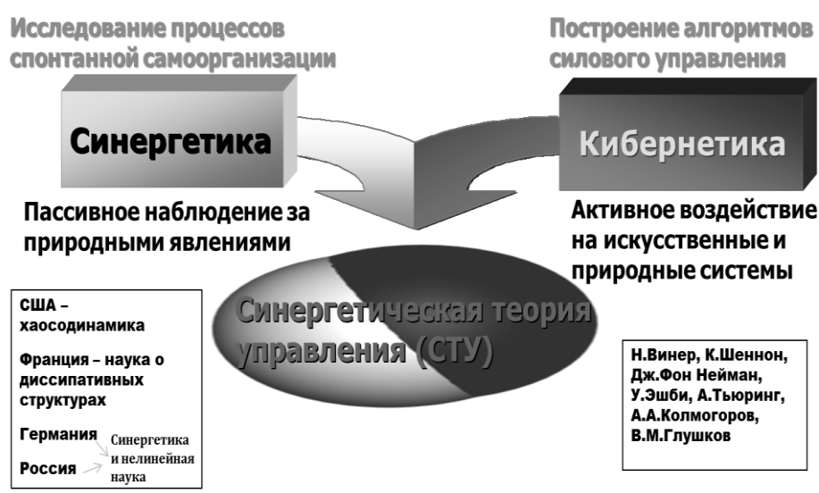
Рисунок 1 – Базовые положения кибернетической и синергетической теории управления

В 1976 г. И. Пригожин сформулировал самоорганизацию как процесс возникновения диссипативных структур в открытой системе и из хаоса (при наличии энергии извне).