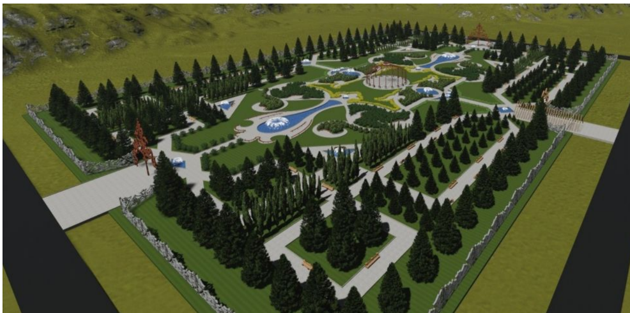
Рис.1. «Арча парки» ботанические сады как природно-ландшафтные парки кочевников

По площади делятся на несколько групп: малые – до 30 га, средние – 30 – 100, крупные – 100 – 300 и крупнейшие – свыше 300 га.