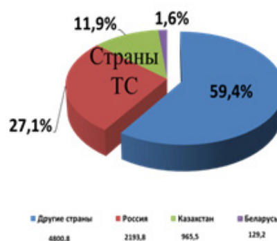
Рисунок 1 – Структура товарооборота КР со странами ТС [2]

40,7 %, в том числе в экспорте – 27,8 % (с учетом золота), 44 % (без учета золота) и импорте – 44,9 %. Самый большой удельный вес в товарообороте Кыргызской Республики занимает Российская Федерация – 27,1 %, далее Казахстан – 11,9 %, и на Беларусь приходится 1,6 % (рисунки 1, 2).