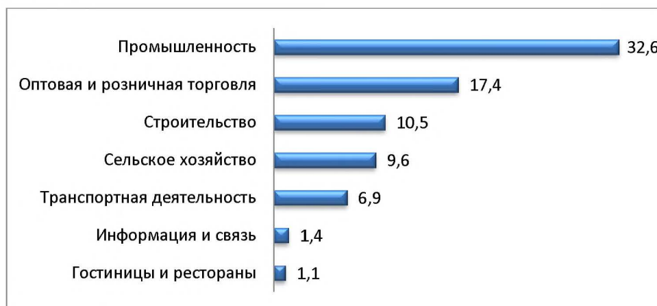
Рис. 2 – Доля предприятий МСП Чуйской области в общем числе предприятий области по видам экономической деятельности, %

Доля промышленных предприятий МСП в общем количестве предприятий области составляет почти 33% (рис. 2). Остальные предприятия МСП заняты в таких сферах, как оптовая и розничная торговля, строительство, транспорт, информация и связь, а также гостиницы и рестораны.