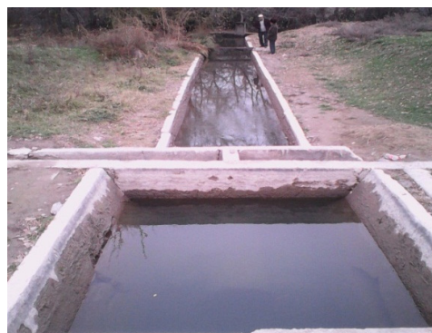
Рисунок 3 – Водомер типа КНСБ на Р-3 ЗБЧК

На этом водомере водовод будет работать в напорном режиме как при свободном (рисунок 2, г), так и при подтопленном (рисунок 2, д) режимах