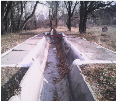
Рисунок 1 – Водомерное сооружение типа “фиксированное русло” на канале Белек-1, р. Ала-Арча