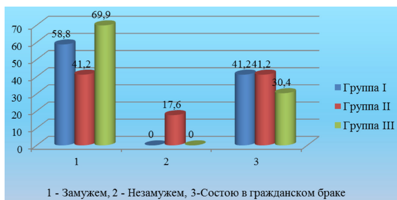
Рисунок 1 – Семейное положение женщин в группах 1, 2 и 3 (%)

живание амбивалентных состояний радости и тревоги; женщины склонны испытывать опасения относительно образа ребенка, своих взаимоотношений с ним, процесса беременности и родов;