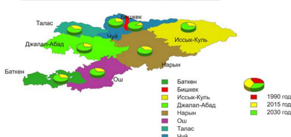
Рисунок 1 – Динамика и прогноз численности мечетей в Кыргызстане