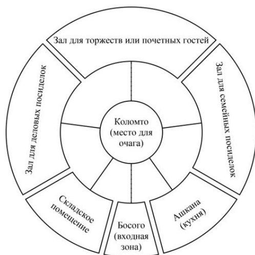
Рис.3 Функциональная схема чайханы.

Образно-пластический язык архитектуры чайханы в функционально-пространственных элемента.