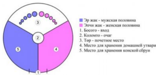
Рис.1 Планировка юрты.