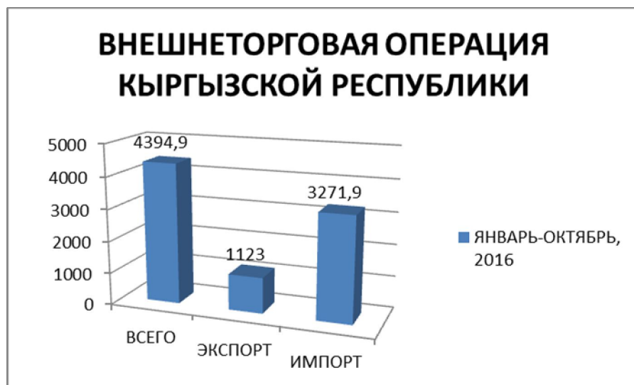
Рис. 2. Внешнеторговая операция Кыргызской Республики на 2016 год