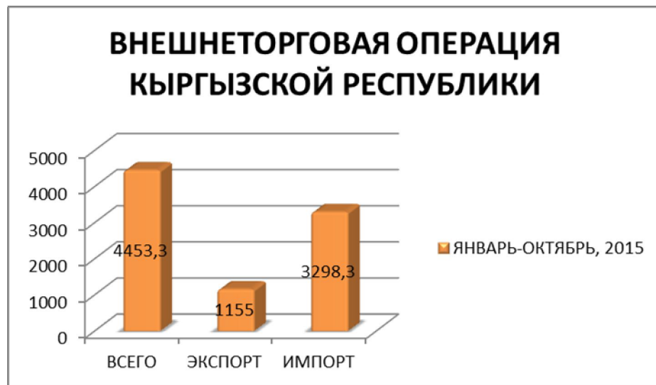
Рис. 1. Внешнеторговая операция Кыргызской Республики на 2015 год